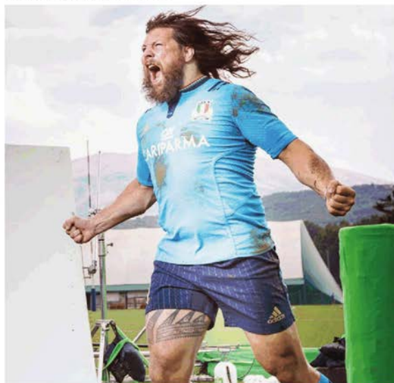
Martin Castrogiovanni, 33 anni, nello spot Sky CRUCIANI

«Davvero bello sentirsi attori per un giorno. Un'occasione divertente per promuovere l'immagine del nostro rugby in Italia».