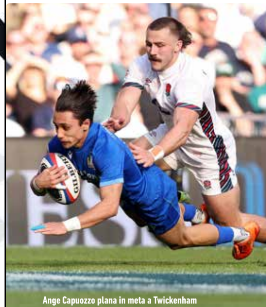
Ange Capuozzo plana in meta a Twickenham