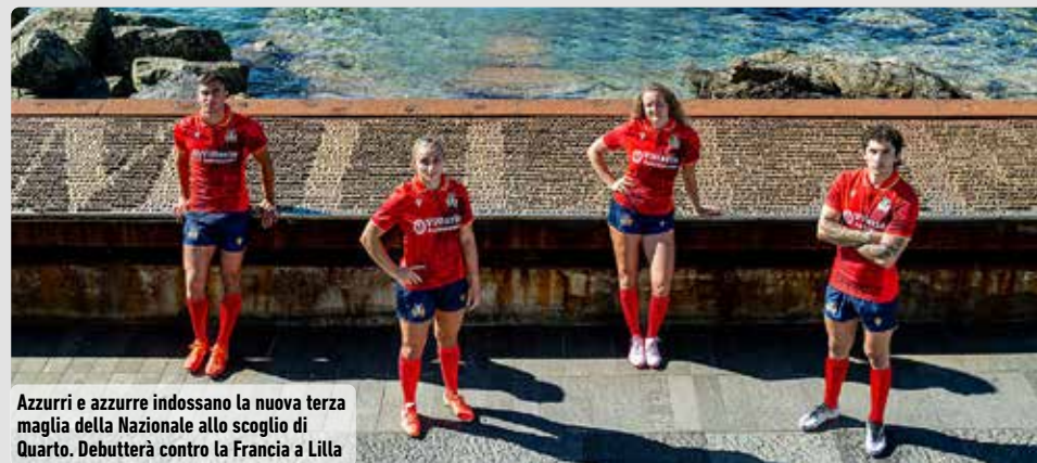
Azzurri e azzurre indossano la nuova maglia della Nazionale allo scoglio di Quarto. Debutterà contro la Francia a Lilla

(*) = meta, cp, tr e drop in una sola partita