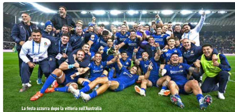
La festa azzurra dopo la vittoria sull'Australia