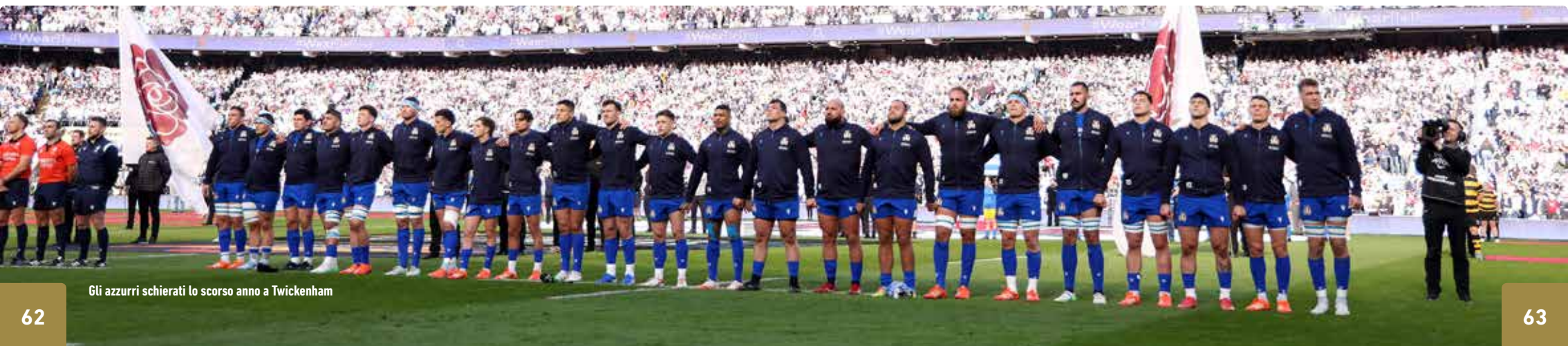
Gli azzurri schierati lo scorso anno a Twickenham