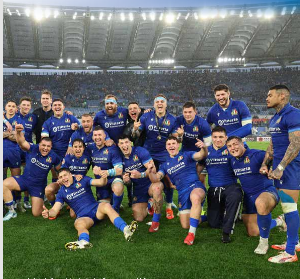
La festa degli azzurri dopo la vittoria dello scorso anno sul Galles