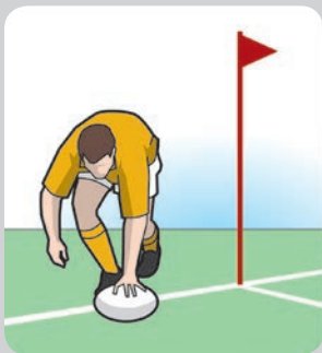
Giocatore in touch di meta, non portatore del pallone, che fa un toccato a terra e segna una meta