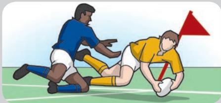
Giocatore tocca il paletto d'angolo prima di fare un toccato a terra

Se il pallone o il giocatore in possesso del pallone tocca una bandierina o il paletto di una bandierina (d'angolo) in corrispondenza dell'intersezione tra la linea di touch di meta e quella di meta o dell'intersezione tra la linea di touch di meta e quella di pallone morto, senza essere in altro modo in touch o in touch di meta, il pallone resterà in gioco, a meno che non venga prima messo a terra contro un paletto di una bandierina.